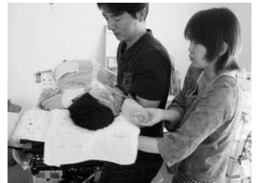
ご両親に抱えられる尊君

お預かりする前、ご両親には不安がありました。初日には、ご両親はお昼過ぎまで一緒に滞在、尊君が大丈夫なのを確認してからの外出となりました。減多に離れることがないので、どんなところであっても不安はあるということがよくわかりました。これは最初に保育所にわが子を預けるお母さんの心境かもしれません。