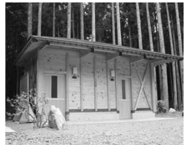
香りがクセになる檜のトイレ