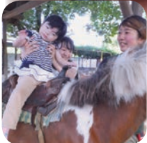
ポニーさんゆっくりね