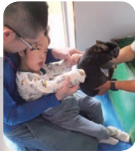
ほら、 ふわふわだね