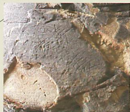
天井に刻まれた文字「姜」ほか入院していた朝鮮人兵士が刻んだものと見られています。