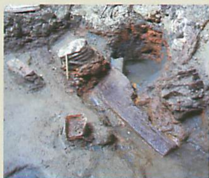
入院患者のものと思われる 石鹸箱・筆箱・防毒マスクの吸収缶