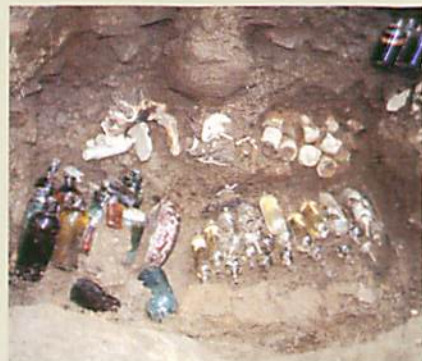
埋められた医薬品類 地中に多数の医薬品類が隠すように埋められていました。

南風原町は1990(平成2)年戦争の悲惨さを伝える証として、第一外科壕群・第二外科壕群を町の文化財に指定した。