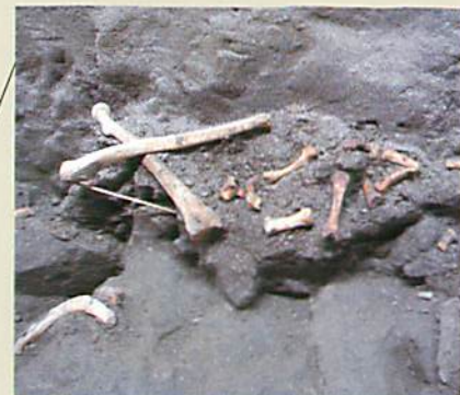
発掘された人骨(腕の骨など) 十字路から東口までの右側壁沿いには幅約90cmの棚が二段あり、患者の病室として使われました。