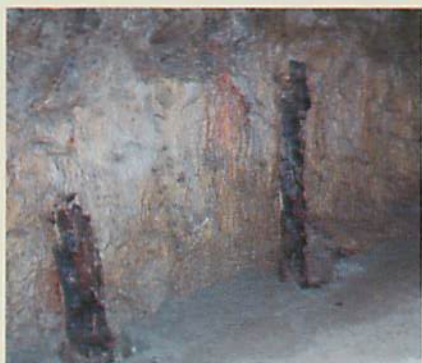
焼け残った坑木 黒く焼けた坑木や壁、天井は米軍の炎放射器によるものと考えられています。