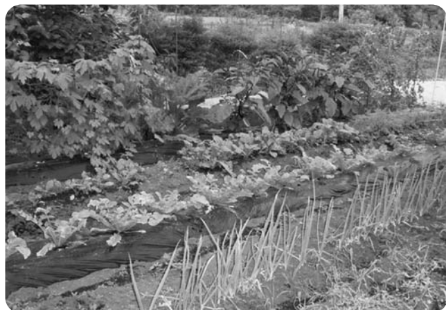
3分の1に縮小して再スタートした「ひばり畑」(2008年7月)

うりずんの開設に伴い、畑を減らして屋根つき降車場と、スタッフの駐車場を整備する必要がありました。「手入れができないなら、やめてはどうか」という意見もありましたが、作物とのふれあいの時間はなん