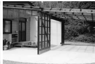
▲屋根つき降車場 ▲スロープとリフトを完備した入口