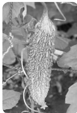
にがうり。「ゴーヤちゃんぶる」が楽しみです

何でも大きすぎると、目が届きません。畑は「ほどほどに」小さいほうが良いと実感しています。