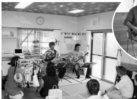
▲チームうりずんの三線演奏