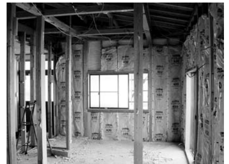
ただ今工事中 (柱を撤去してワンフロアになります)

市の委託事業となると、さまざまな準備が必要になります。まず、預かりに必要な場所を整備する必要があります。医療的ケアを必要とする子どもを3人預かる予定なので、