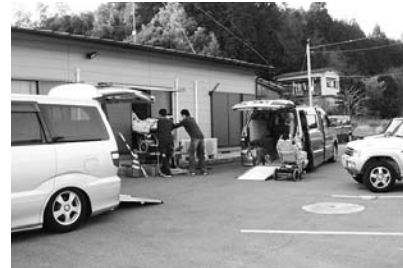
ふたりのお迎えで駐車場は一杯になる

6畳和室ではとても足りません。そのため、奥にある6畳和室との壁を抜いて廊下も含め15畳ほどのワンフロアをフローリングにします。冬はとても寒いところなので、深夜電力を利用した蓄熱暖房装置をおき、窓も床も断熱構造にします。クリニック