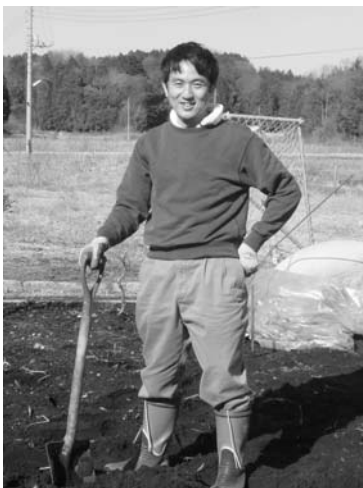
聴診器をスコップに持ち替えて…

クリニックの裏にある畑は、もともと荒れた土地でした。全部駐車場にするほどお客もないだろう、でもこのままでは草も生えてもったいない、そこで畑にしようということになりました。きれいにして良い土をどっさりを入れ、いろいろな方にお世話になって見違えるような畑ができました。