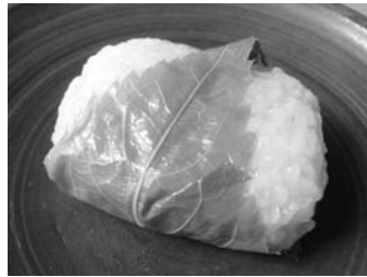
可愛い桜餅「はざくら」

宇 都宮の戸祭にある「いわ澤」という和菓子屋さんに、その「はざくら」はあります。上品な口の方でも二口で入ってしまう可愛い桜餅なのですが、これがまたうまいのであります。一年中売られています、人気の品のためかよく売り切れます。